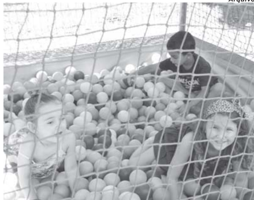
Ruas de lazer serão montadas na cidade para as comemorações do dia 1º de maio

Dois eventos estão programados para acontecer em São Sebastião do Paraíso neste domingo, 1º de Maio, quando se celebra o Dia do Trabalhador. Uma das ações é promovida pela Prefeitura que tradicionalmente ocorre nas imediações da Praça da Abadia e em parceria com o Operário Esporte Clube. Outra é da Fetramov com show musical na região da Casa da Cultura e Praça Olegário Maciel.