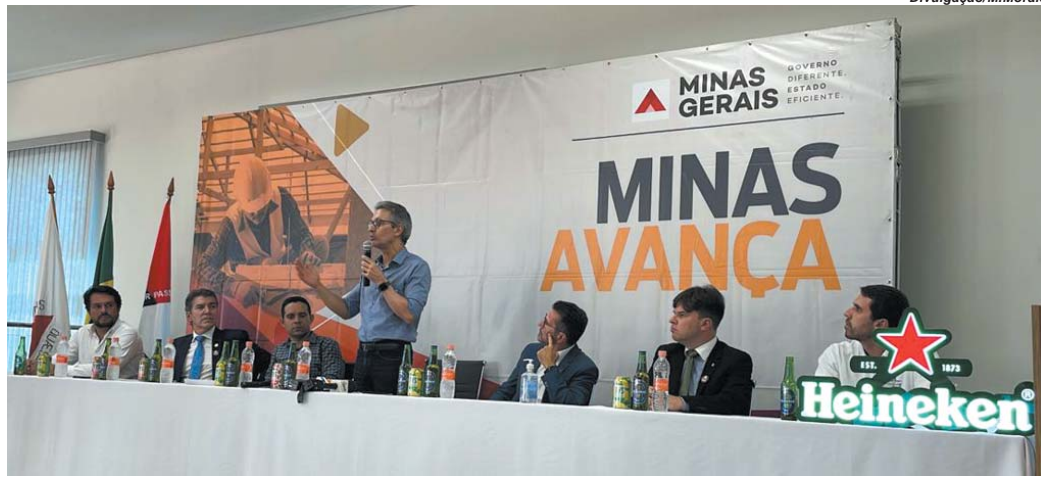
Lideranças do Governo do estado, do grupo cervejeiro e do município Passos fizeram o anúncio da instalação da fábrica em Passos

Desde o impasse ocorrido no final do ano passado em Pedro Leopoldo, onde inicialmente, seria construída, a em-