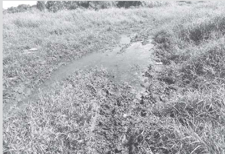
Poço formado por vazamento de água poluída de esgoto urbano, fica na rua Estrada de Ferro e dificulta o trânsito de pedestres e veículos

Para apurar a denúncia o JS foi ao local e constatou que realmente além de impedir passagem de transeuntes, se trata de também na questão de saúde pública e poluição do meio ambiente. A água de esgoto correndo a céu aberto, polui o solo, ar e ainda vai desaguar no Córrego Carrapatinhos, onde a água é usada por animais.