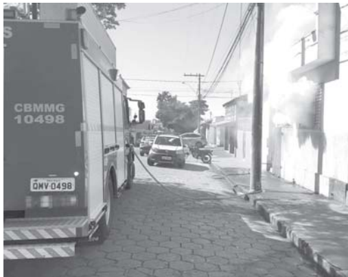
Ocorrência foi registrada em uma residência do bairro Nossa Senhora Aparecida na tarde de quinta-feira

Soldados do Corpo de Bombeiros do 2º Pelotão do Corpo de Bombeiros, em São Sebastião do Paraíso foram acionados para o combate a um incêndio em residência, no bairro Nossa Senhora Aparecida, na tarde desta quinta-feira, 28. Conforme informações um morador do local, usuário de drogas, teria tentado contra a própria vida. Transtornado por não conseguir dinheiro para aquisição de entorpecente e após ameaçar familiares ele ateou fogo na residência. O incêndio foi contido pela ação