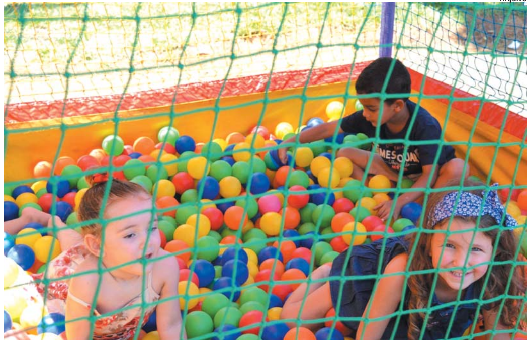
Ruas de lazer serão montadas na cidade para as comemorações do dia 1º de maio

Mercado Central ampliará suas instalações em mais de mil metros quadrados