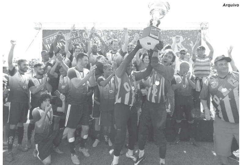
Operário enfrenta Cruz das Posses, no regional da Liga Serranense e tenta repetir campanha de 2019