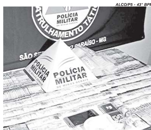
Material apreendido em Paraíso foi recolhido e encaminhado para a Delegacia de Polícia

Um homem suspeito de tráfico foi preso, e vários materiais entre frações de drogas, embalagens de entorpecentes, aparelho celular entre outros objetos apreendidos em sua residência, no Jardim das Acácias, em São Sebastião do Paraíso, quarta-feira, 27. Durante abordagem de rotina, e se portou com atitudes suspeitas. Segundo informações divulgadas pela PM o suspeito de tráfico foi detido inicialmente durante uma abordagem no bairro Jardim das Acácias. O homem de 32 anos apresentou comportamento suspeito ao perceber a presença policial. Ao ser submetido a revis-