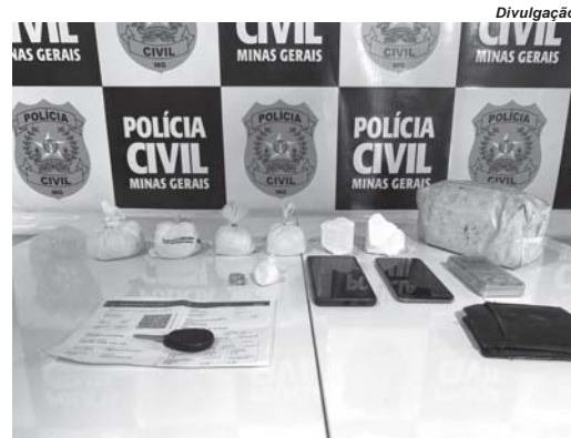
Drogas, veículo, celulares e outros materiais foram apreendidos durante a operação policial no Jardim Belvedere

Dentro da bolsa carregada pelo primeiro suspeito, a polícia descobriu meio quilo de cocaína. Depois, a busca na