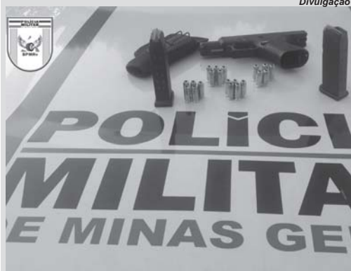
Arma e munições foram localizadas e apreendidas pelos policiais rodoviários

Autor chegou a negar possuir itens ilícitos dentro de seu veículo, porém, policiais encontraram pistola carregada e ‘pente’ adicional com mais munições