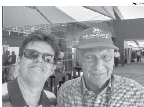
Uma self deste colunista com Niki Lauda, em Interlagos

De Mônaco para Indianápolis, independente do que acontecer, as 500 Milhas já tem um vencedor: Kyle Kaiser(!). Um dia antes da classificação, Kaiser destruiu o carro da modesta Juncos Racing no muro. Os mecânicos tiveram que varar a madrugada para recolocar o carro todo branco, sem patrocínio, na pista no dia seguinte. Não havia peças de reposição e foi preciso a ajuda de outras equipes. No sábado, Kaiser fez o