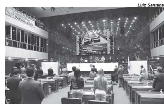
O projeto de autoria da Defensoria foi votado na Reunião Extraordinária da manhã do último dia 19/4

Os percentuais de recomposição serão de 6,14% para o subsídio dos defensores públicos, referente ao período de dezembro de 2021 a dezembro de 2022, e de 7,12% para