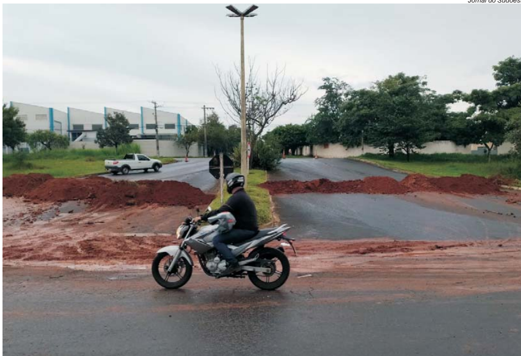
Vias de acesso para bairros foram interrompidas, causando grande transtorno

Operação entre PM e Civil prende quadrilha de assaltantes em Monte Santo