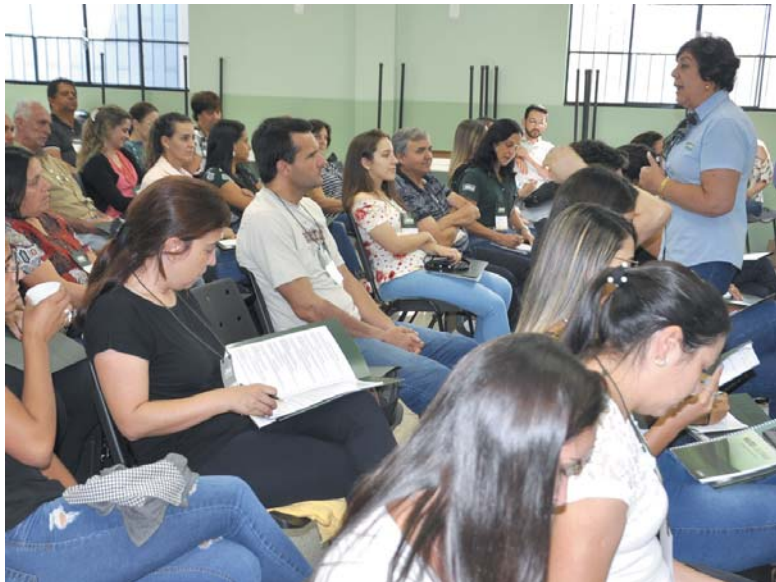
Evento na Acissp reúne 60 mobilizadores do Senar que debatem propostas de trabalho e atuação junto ao homem do campo