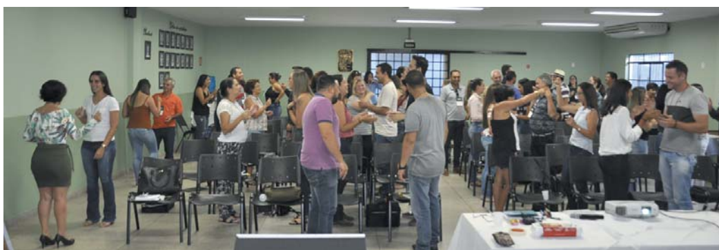
Durante as atividades participantes do encontro realizaram várias dinâmicas em grupo