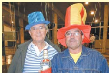
Senhor Penha e Batata