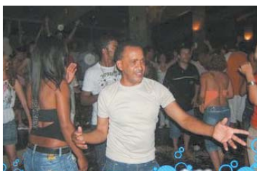
Calvet da Banca