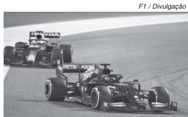
Disputa entre Mercedes e Red Bull é uma das atrações em Imola

Este será o 29º GP em Imola, o 101º da F1 em território italiano. E é novamente por causa da pandemia que esta pista raiz, modernizada para atender aos padrões de segurança da Federação Internacional de Automobilismo, ganhou uma nova oportunidade de receber a segunda etapa do Mundial. No ano passado, Lewis Hamilton venceu pela 93ª vez na carreira (atualmente são 96 vitórias), e a Mercedes conquistou por antecipação o 7º título de Construtores.