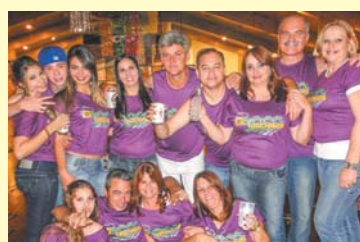
PH Cabelreiro entre familia e amigos