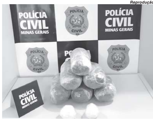
menda de entorpecentes que estaria a caminho da cidade, policiais da Delegacia Regional em São Sebastião do Paraíso

Conforme a PC, após receber informações da agência de inteligência do Departamento Estadual de Combate ao Narcotráfico (Denarc) em Belo Horizonte, e da agência de inteligência do 18º Departamento de Polícia em Poços de Caldas, referentes a uma enco-