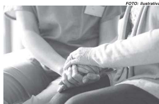
MP pediu medida protetiva para mulher que sofria ameaças e chantagens do filho

O MP ajuizou o pedido de medida protetiva sob o argumento de que o homem, devido ao vício em drogas, agride a mãe, física e psicologicamente, com frequência toma o dinheiro dela e se nega a fazer tratamento. Segundo o órgão, o constante envolvimento dele com traficantes também expõe