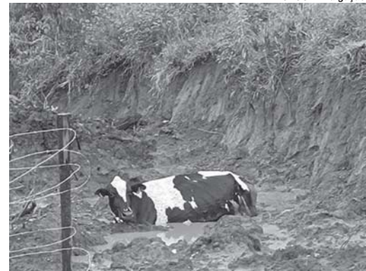
No último final de semana, a vaca Beterraba caiu no lamaçal e não conseguiu sair do lugar