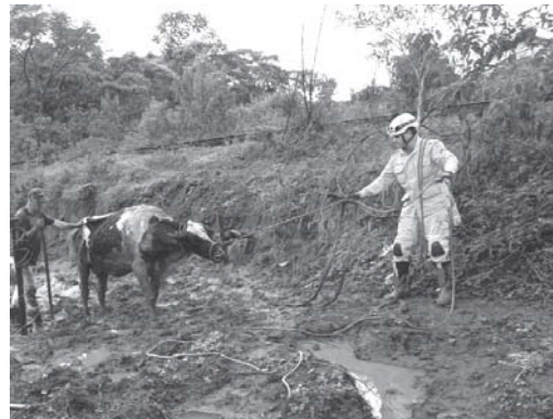
Bombeiros trabalharam debaixo de muita chuva para conseguir resgatar o animal preso na lama

Já em local seguro, a vaca, que atende pelo nome de "Beterraba", passou por uma avaliação minuciosa do proprietário, que não identificou nenhum tipo de ferimento no animal.