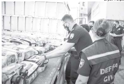
Ação vai ajudar famílias em vulnerabilidade diante da crise sanitária enfrentada pelo País

A Secretaria Municipal de Desenvolvimento Social recebeu, por meio da Coordenadoria da Defesa Civil de São Sebastião do Paraíso, quarta-feira, 11 de agosto, a doação de 100 cestas básicas que serão destinadas a famílias em situação de vulnerabilidade social do município. O trabalho é uma parceria entre a Defesa Civil do Estado, da Igreja Jesus Cristo dos Santos dos Últimos Dias e das Defesas Cívicas dos municípios contemplados.