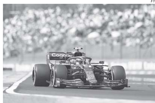
O litro de gasolina que faltou no tanque do Aston Martin de Sebastian Vettel pode ser o vilão da disputa entre Hamilton e Verstappen

Neste momento, a mudança do campeonato sofreu alteração. Hamilton subiu para 2º na corrida, e Verstappen para 9º, mas a diferença entre eles aumentou de 6 para 8 pontos: 195 para Hamilton, contra 187 de Verstappen.