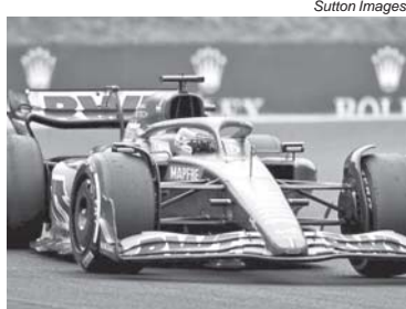
A Alpine que podia escolher entre Alonso e Piastri, tomou rasteira dos dois

Há um copo meio cheio e meio vazio quando se olha para o grande investimento que a Alpine fez na formação de Piastri e ele dar as costas e assinar com a McLaren que neste momento não está muito acima do potencial