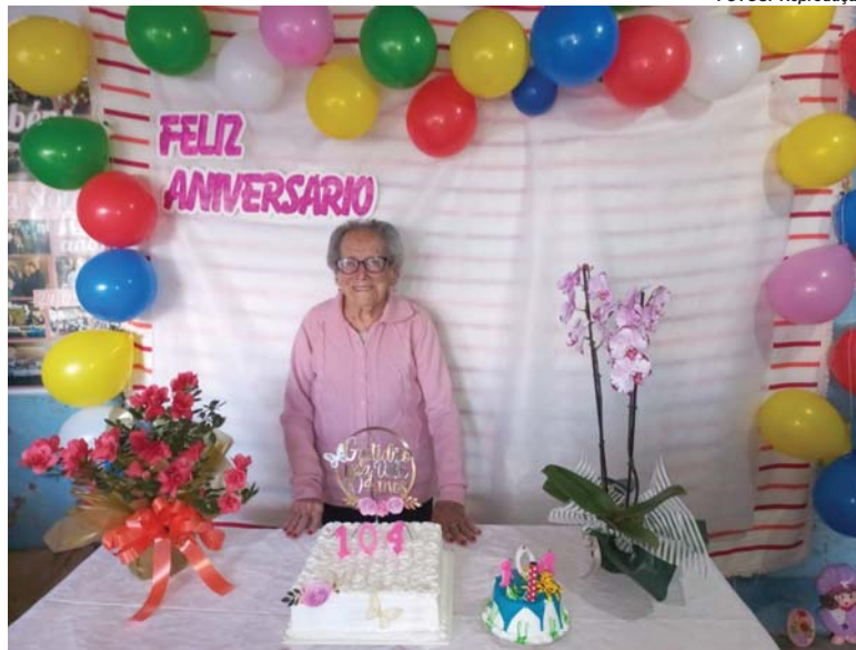
Idosa ganhou festa de amigos e familiares no dia de seu aniversário

Mas a vida, em suas imprevisibilidades, trouxe desafios que testaram a fé de Luiza. Primeiro, o marido e companheiro de tantas batalhas adoeceu e acabou morrendo pouco tempo depois de o casal voltar a Paraíso. Depois, um a um, os filhos contrariaram aquela que deveria ser a ordem natural das coisas e também faleceram, deixando a mãe. A dor das perdas das pessoas mais im-