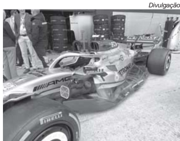
Site alemão aponta 287 alterações aerodinâmicas nos carros da F1 até aqui

Embora as atualizações cumpram o seu propósito de melhorar o equilíbrio e desempenho dos carros, me chamou atenção no estu-