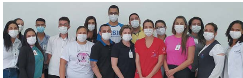
Em Paraíso a Santa Casa criou uma equipe de embaixadores que vão atuar na campanha em prol da instituição

A Santa Casa de Misericórdia de São Sebastião do Paraíso aderiu ao movimento Dia de Doar que mobiliza a sociedade para doações à entidade. No hospital foi criada uma equipe de embaixadores que vão atuar nas ações locais e regionais de captação e mobilização junto aos governos, empresas e pessoas em busca de recursos para a instituição.