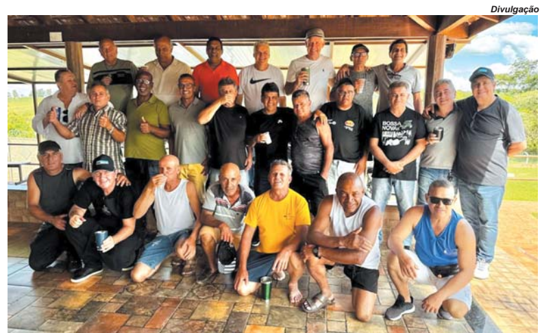
Terceiro encontro da turma de Atiradores do TG 04-025, do ano de 1986, em São Sebastião do ParaísoA