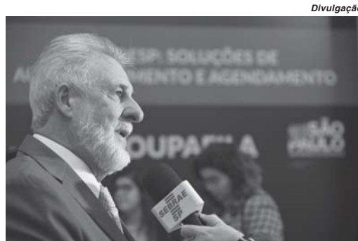
Segundo presidente do Sebrae, volume de ações de crédito alcançado por Sicoob e Sicredi coloca o sistema de cooperativas à frente de instituições financeiras públicas e privadas

Ao analisar a taxa de sucesso dos pedidos de empréstimos, o Sebrae identificou que coope-