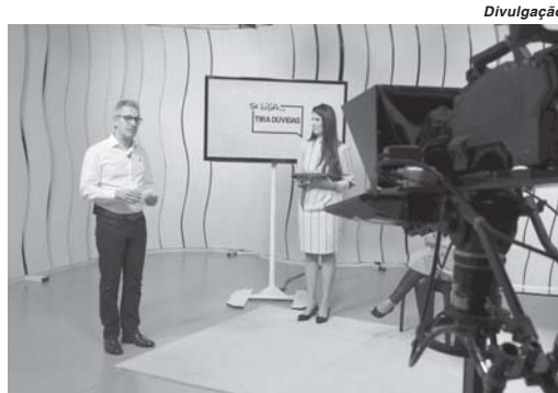
Com decreto de pandemia estudantes estão realizando atividades remotas de casa

Conforme a secretária, o ano letivo de 2020 com as aulas presenciais teve início em fevereiro, mas precisou ser interrompido a partir de 18 de março com o decreto de pandemia. Neste período já foram vivenciados cerca de 15 dias de férias antecipadas, que não foram especificadas de qual período, se referente a julho ou janeiro. "Recebemos e seguimos as orientações do Es-