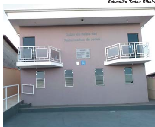
Salão do Reino das Testemunhas de Jeová, localizado na Rua Sta. Luzia, no Jardim Europa 3

Em São Sebastião do Paraíso existem três Salões do Reino das Testemunhas de Jeová, um na Rua Lopes Trovão, Bairro Independência, na Rua Sta. Luzia, no Jardim Europa e na Rua José Borges Campos, Parque São Judas Tadeu.