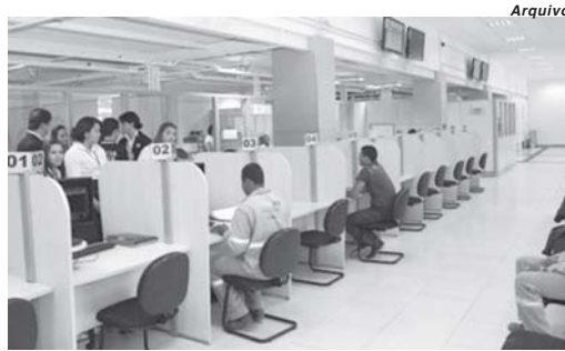
No estado, 30 unidades instaladas em UAIs passam a atender os trabalhadores que buscam emprego mediante agendamento prévio

O atendimento ficou paralisado desde o início do decreto de calamidade pública com