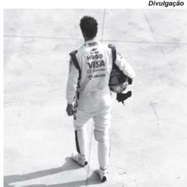
Daniel Ricciardo, um dos pilotos mais queridos da F1 se despede elancolicamente sem entregar os resultados que se esperava

Não é por aí, e Verstappen é mais um dos muitos exemplos de que não basta só o talento se