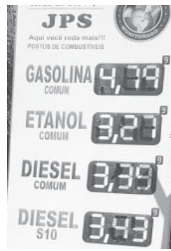
No Posto JPS que fica localizado na Av. Brasil, no Parque São Judas Tadeu, é onde se vende o preço do litro de etanol e do diesel mais barato em Paraíso

Vocês não têm em Minas alguém que lute em defesa dos consumidores, onde estão autoridades, questionou o consumidor paulista, ao fazer outros comentários que em respeito aos leitores, não serão aqui colocados.