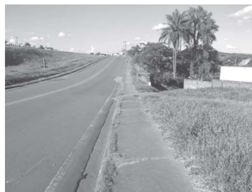
Moradores no Jardim Itamarati, Ipanema e Alvorada, solicitam iluminação pública neste trecho da avenida Florentino Cândido de Rezende

Conforme verificamos, se a Prefeitura determinar a colocação de pelo menos três pos-