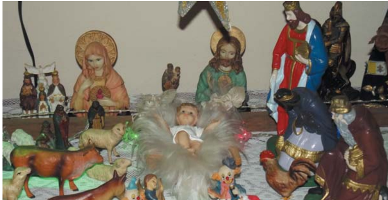
Confeção de presépios e as folias de reis fazem parte do patrimônio histórico em Paraisópolis e Minas Gerais