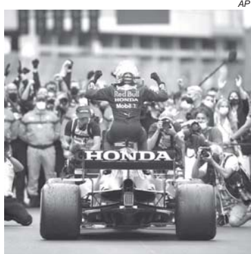
Verstappen sobe no carro para comemorar vitória em Mônaco

E a conversa prossegue. Eles lamentam que a Honda esteja deixando a F1 depois de voltar a conquistar um título Mundial desde a época