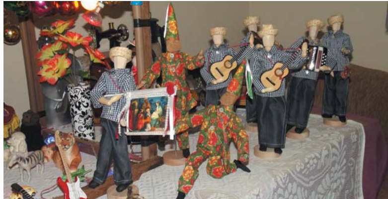
Trabalho em miniatura representa a devoção aos três Reis Magos Melchior, Baltazar e Gaspar