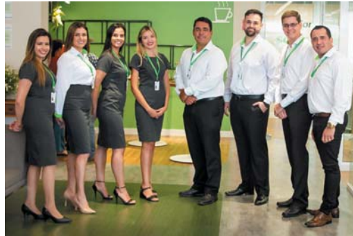
Equipe de atendimento em Itamogi