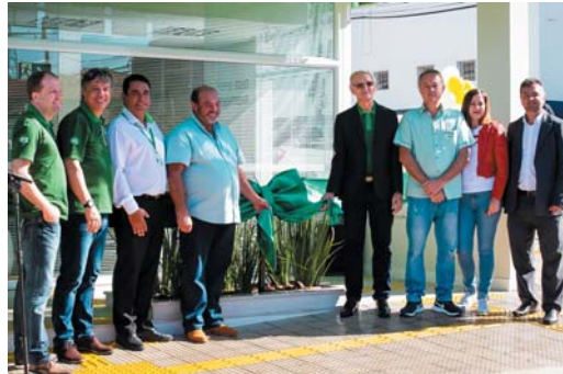
Desenlace da fita inaugural

Esta é a 6ª agência da cooperativa na região. Em todo o estado, o Sicredi já soma mais de 100 agências e 100 mil associados