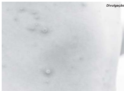
Caso suspeito de varíola dos macacos é investigado por análise laboratorial

Marcelo disse que a paciente está estável sem maiores complicações de saúde. “Ela foi enviada para casa onde encontra-se em isolamento. Nós fazemos o acompanhamento, são feitos contatos três vezes ao dia, ela está se alimentando bem, não tem outras complicações, não há motivos para as pessoas se alarmarem”, relata. Ele ressalta que as medidas tomadas atendem aos protocolos dos órgãos de saúde. “Enviamos o material para a Funed que automaticamente comunica com a Secretaria de Saúde do Estado e o caso é conside-