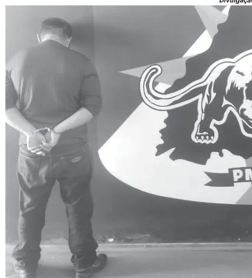
Homem foragido e acusado de envolvimento de vários crimes foi preso pela polícia do Tocantins