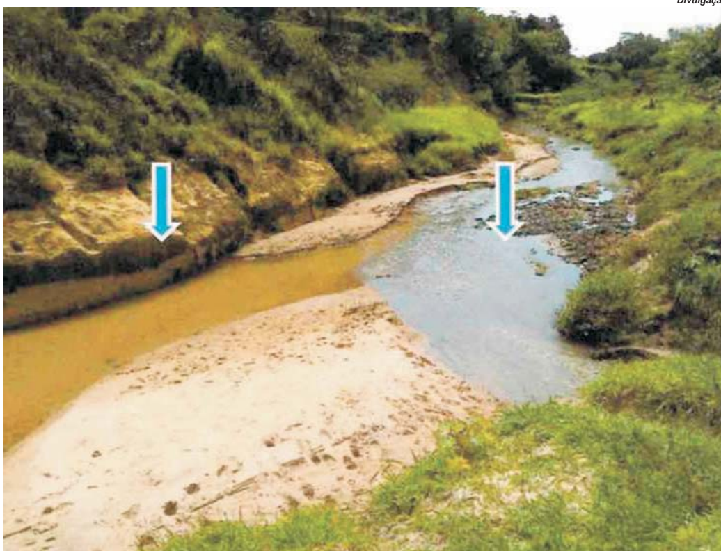
Caso suspeita de varíola dos macacos é investigada por análise laboratorial