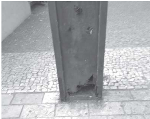
Postinho com luminárias na calçada da Praça Com. José Honório estão sendo corridos pela ferrugem, podendo cair a qualquer instante