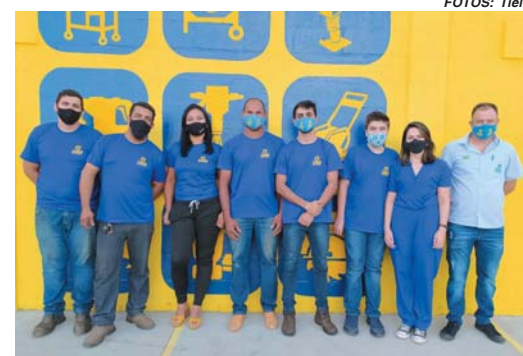
Equipe de atendimento Casa do Construtor

mento nas horas vagas, com depósito no jardim de casa. Lembro que minha mãe foi a primeira colaboradora voluntária e assim iniciamos”, relembra a empreendedora.