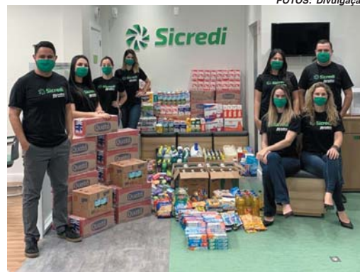
Equipe do Sicredi e doações arrecadadas