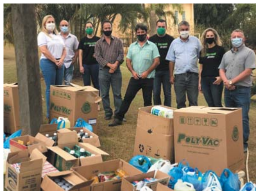
Doação realizada à Chácara Pedacinho do Céu