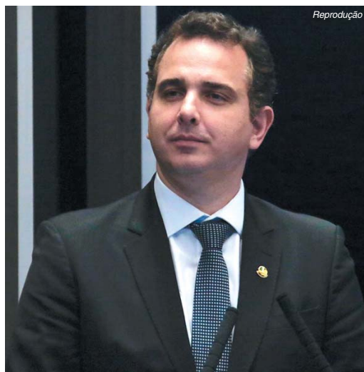
O senador Rodrigo Pacheco (MG)

Conforme dados da Secretaria de Estado de Saúde