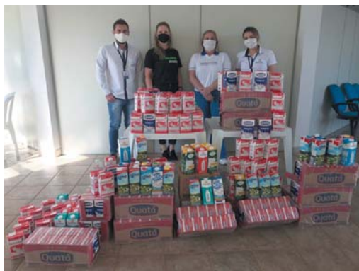
Doação realizada ao Hospital Gedor Silveira