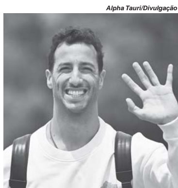
O sorriso sempre presente, o que faz de Daniel Ricciardo um dos pilotos mais carismáticos da F1

Não é bom quando um piloto é demitido no meio da temporada e sem ter tido o tempo necessário para mostrar a sua capacidade. Nyck foi campeão da F2 em 2019 e da Fórmula E em 2021 (pra quem não sabe, o Campeonato Mundial de carros 100% elétricos, cancelado pela Federação Internacional de Automobilismo), ou seja, não é nenhum zé ninguém que caiu de paraquedas na F1. Tanto é