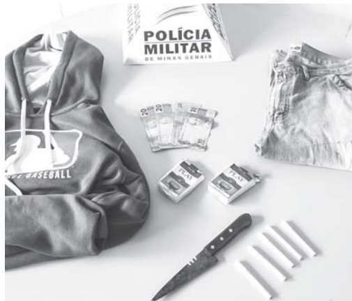
Faca utilizada no assalto e material furtado foram apreendidos, bem como a droga encontrada em outra ocorrência

A Polícia Militar registrou duas ocorrências de destaque durante o feriado de Finados em São Sebastião do Paraíso. A primeira delas foi na manhã de terça-feira, 2, quando um homem de 26 anos assaltou uma mercearia, na praça São José. Depois à noite, em outra ocorrência, um jovem de 19 anos foi preso em flagrante suspeito de tráfico de drogas na Vila Muschioni, com apreensão de material entorpecente.