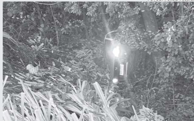
Na tentativa de fuga dos policiais, veículo capotou e caiu fora da pista próximo ao pedágio da rodovia sentido Itaú de Minas

O trabalho contou ainda com apoio da Polícia Militar Rodoviária de São Paulo que participou do acompanhamento que resultou na interceptação dos veículos envolvidos e prisão de um suspeito de tráfico, na chamada 'Rota Caipira'.