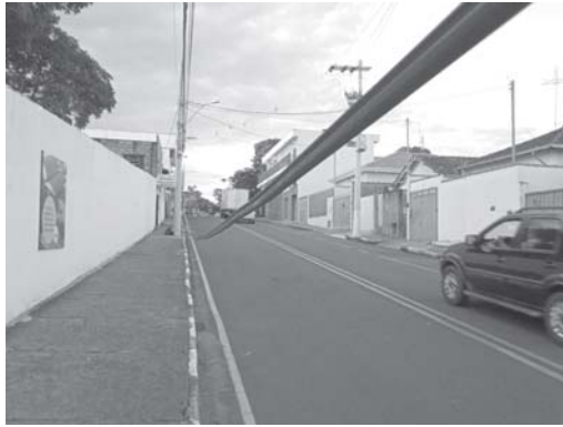
Fios soltos na Rua Tabajara Pedrosa coloca em risco de envolverem em acidentes pedestres e motoristas

Apesar de ter se tornado lei quem anda pelas ruas de São Sebastião do Paraíso pode facilmente deparar-se com fios e cabos soltos por todas as regiões da cidade. Quem passa pela Rua Tabajara Pedrosa na divisa entre os bairros Jardim Coolapa e Lagoinha há semanas encontra um exemplo típico desta situação. O Jornal do Sudoeste constatou que nem mesmo a legislação que prevê a aplicação de multa às empresas infratoras e motivadas pela falta de fiscalização inibem este tipo de situação.