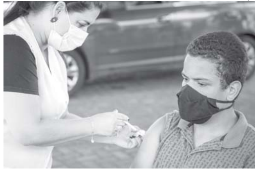
Vacinação de adolescentes amplia quantidade de pessoas imunizadas contra a Covid-19 em Paraíso

Em São Sebastião do Paraíso até a quarta-feira (3/11), havia 8.996 pessoas que ainda não foram vacinadas contra a Covid-19. O número foi divulgado pela Assessoria de Comunicação da Prefeitura em atendimento a solicitação feita pelo Jornal do Sudoeste . A expectativa é de que este volume possa ser reduzido nos próximos dias com o avanço da vacinação que vai alcançar o público adolescente de 12 anos.