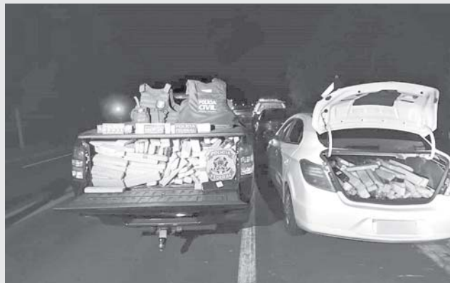
Mais de 600 quilos de drogas foram apreendidas após perseguição na MG-050

O veículo foi interceptado na praça de pedágio na rodovia MG-050 na divisa