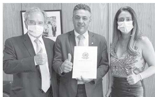
Deputado Emidinho Madeira entre os ministros Paulo Guedes e Flávia Arruda

"Fomos muito bem recebidos pelo ministro Paulo Guedes e ministra Flávia Arruda. Acredito que essa reunião foi a mais importante até o momento sobre o assunto. O ministro ficou convencido e muito motivado com nosso programa de zerar a fila das cirurgias ele-