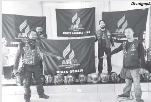
Integrantes de várias outras cidades participarão de motoculto em Paraíso