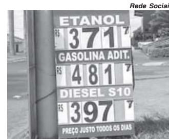
Preços praticados na cidade paulista Altinópolis