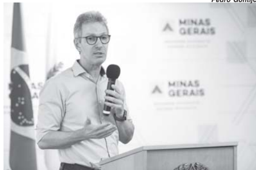
"Romeu Zema falou da criação das novas medidas para o combate ao aumento dos novos casos de Covid-19 em Minas"

O governador de Minas Gerais, Romeu Zema, anunciou no meio da tarde desta quarta-feira, 3, a criação da Onda Roxa dentro do plano Minas Consciente. A medida é mais restritiva e impositiva aos municípios das regiões atingidas e prevê a adoção do toque de recolher no período de 20h às 5h e abertura das atividades essenciais. São Sebastião do Paraíso que está na região Sudoeste de Minas que se encontra na Onda Amarela não foi atingida pelas decisões que devem ter duração de pelo menos 15 dias. Inicialmente as medidas da Onda Roxa estão sendo adotadas nas regiões do Triângulo do Norte e Noroeste onde está sendo registrado o colapso regional do sistema de saúde. Nestas áreas segundo o governador houve até mesmo casos de transferências de pacientes para cidades polos. Já as regiões do Triângulo do Sul e Leste do Sul que se encontram na Onda Vermelha serão acompanhadas sistematicamente e poderão ser incluídas na nova fase caso os índices de contaminações e mortes pela Covid-19 continuem aumentando nestas áreas.