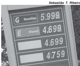
Preço de combustíveis em um posto de Paraíso