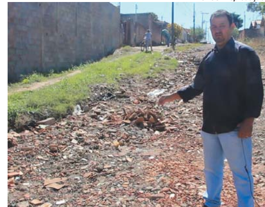
Rua Jaime Batista da Silva no Jardim das Acácias

o que temos feito", disse. O vereador também lembrou outras cobranças feitas, entre elas a construção de re-