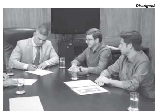
Secretário assinou autorização aos prefeitos para que municípios de Paraíso e Lagoa da Prata possam fazer licenciamento

Até o momento o processo de Licenciamento Ambiental era realizado pelo Estado, o que gerava morosidade até a emissão da licença, tendo em vista a complexidade dos processos e a solicitação por parte do órgão licenciador de informações complementares. Desde 2017 quando foi flexibilizada a possibilidade de emissão das autorizações que o município para-