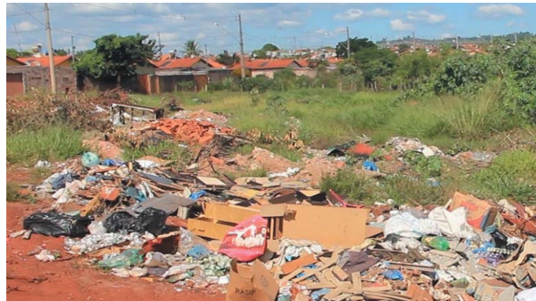
Sem ter onde descartar entulho, moradores descartam às margem do bairro Santa Tereza

Além disto, o vereador falou da necessidade de se colocar uma coleta regular de entulhos nos bairros São Sebas-