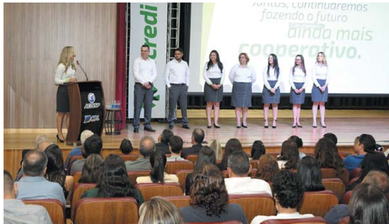
Equipe do Sicredi que irá atuar em São Sebastião do Paraíso

No aspecto voltado ao cooperativismo, explanou sobre a noção entre cooperação versus competição, destacando a importância da primeira para a resolução de problemas. "Ao invés de ser um contra o outro é um mais o outro contra o problema. É por isso que o cooperativismo é o melhor sistema social, político, econômico e espiritual já desenvolvido na história da humanidade. Não é apenas um meio de produção, é uma forma de viver, uma filosofia que educa as pessoas para a vida", destaca. Quem compareceu ao