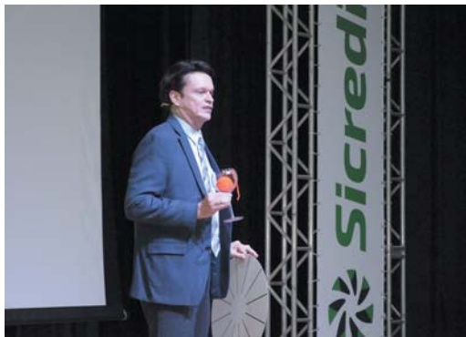
Palestrante Carlos Hilsdorf

Cerca de 200 pessoas participaram quarta-feira (4/12), da palestra "Construindo a melhor versão do futuro", ministrada pelo renomado conferencista Carlos Hilsdorf, em evento promovido pela Sicredi das Culturas RS/MG em São Sebastião do Paraíso. A programação faz parte das ações que marcam o início das atividades da instituição financeira cooperativa no município e também contou com apoio da ACIISP e da CDL.