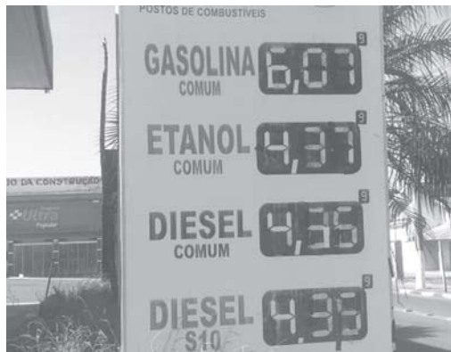
O Posto JPS, na Av. Brasil no Parque São Judas Tadeu, é onde combustíveis estavam mais baratos em Paraíso, sexta (7/5)

Terça-feira (4/5), um consumidor paraense que estava