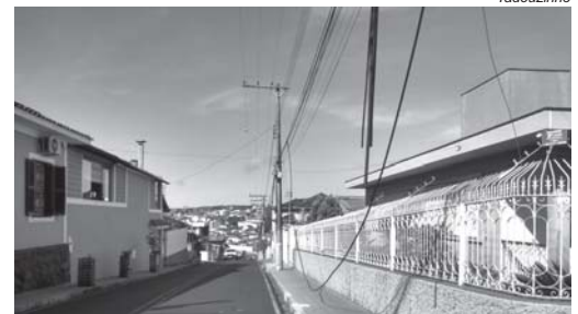
Fiações arrebitadas de telefonia fixa, deixa usuários na mão, podendo também oferecer risco de acidentes com pedestres

los quatro cantos do perímetro urbano de Paraíso, um descaso total, sem nenhuma punição aos infratores. A Prefeitura e a Câmara Municipal deveriam intimar os responsáveis pelas empresas concessionárias de telefonia, Internet e Cemig, e determinar aos responsáveis para tomarem as devidas providências, para sanar este problema o mais breve possível, sobre pena de ação judicial para punir os culpados, pedem e com total razão, os reclamantes.