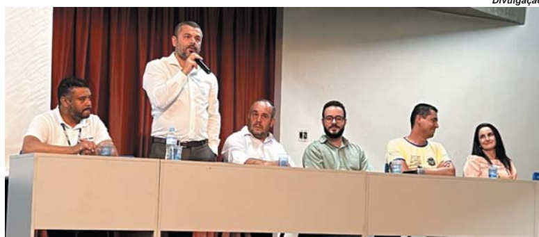
Na abertura do evento foram realizadas palestras e debates com a presença de vários convidados