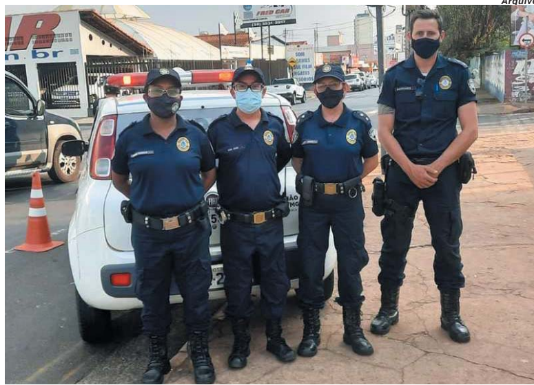
Proposta semelhante foi arquivada em 2019 que manteve os 30% do adicional de insalubridade destinado aos Guardas Municipais

O projeto de 2019 foi apresentado com a justificativa do Executivo de ter sido notifica-