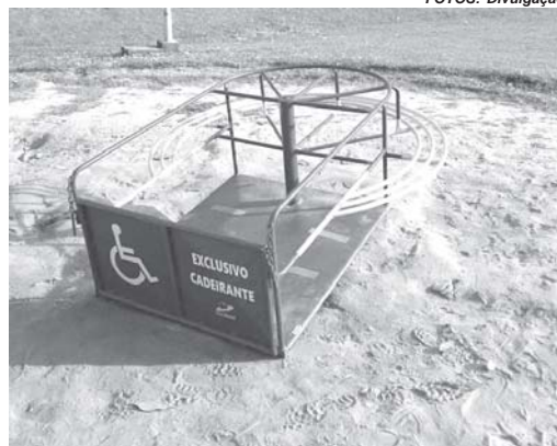
Aparelho similar foi instalado e é utilizado no Parque da Lagoinha, inclusive por moradores de outras cidades

Cerca de 15 dias após a Prefeitura de São Sebastião do Paraíso, ter instalado brinquedos adaptados para crianças com deficiência física em parques infantis do município, um dos equipamentos foi destruído no bairro San Genaro. A cena com o brinquedo quebrado vem chamando a atenção de pessoas que passam pelo local e também de quem acompanhou a situação pelas redes sociais, após o prefeito Marcelo Moraes divulgar imagens de como ficou o aparelho.