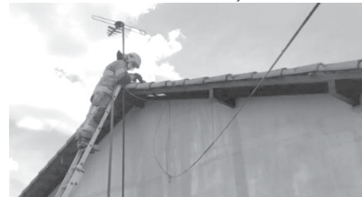
Ação rápida dos bombeiros evitou que incêndio se propagasse em residência no Jardim Europa

Unidades de Salvamento e Resgate foram encaminhadas para o local do acidente. O motorista da Pampa, um homem de 76 anos já estava sendo atendido por uma equipe do Pronto Socorro de Itamogi. Ele sofreu ferimentos leves, provavelmente provocados por estilhaços da quebra dos vidros.