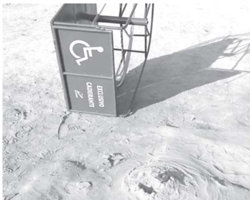
Equipamento foi destruído por vândalos no parque do Complexo San Genaro