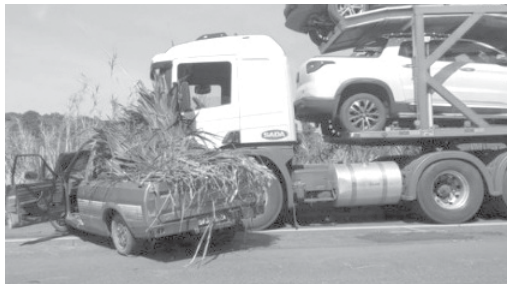
Colisão foi registrada na MGC-491 após tentativa de ultrapassagem de Pampa sobre carreta

Duas ocorrências mobilizaram equipes do Corpo de Bombeiros de São Sebastião do Paraíso na manhã desta segunda-feira (21). O primeiro caso foi uma colisão frontal registrada na MGC-491, entre Monte Santo de Minas e Paraíso e envolveu uma pick-up Pampa e uma carreta Scania. Outro chamado foi registrado por volta do meio dia com um princípio de incêndio em uma residência no bairro Jardim Europa, onde a atuação dos combatentes do fogo evitou que as chamas se espalhassem e causasse maiores prejuízos.