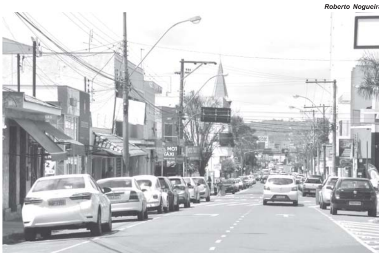
Roberto Nogueira Condutores de veículos devem se atentar para a fiscalização de documentos obrigatórios de 2022

Os proprietários de veículos que ainda não possuem o CRLV de 2022 devem acessar o site oficial do Detran-MG para verificar se há débitos do IPVA, seguro obrigatório, Taxa de Renovação do Licenciamento Anual do Veículo e eventuais multas.