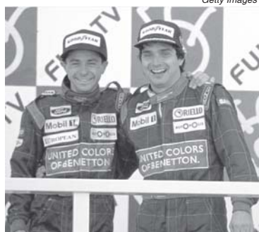
Há 30 anos o Brasil acordou 'dono da F1' com o título de Senna e dobradinha de Piquet e Moreno no GP do Japão

Aquilo deixou o piloto indignado, já que seu esforço com um carro ruim estava sendo em vão. E decidiu bater na porta da Brabham que estava à procura de piloto para o ano seguinte. Enquanto aguardava o chá de cadeira para falar com o dono do time que não resultaria em nada, Moreno ligou para dar um alô ao amigo John Barnard, diretor-técnico da Benetton, por estar próximo de seu escritório, em Londres, e sem nenhuma pretensão, disse que estava na Brabham, à procura de emprego! Barnard o convidou para um chá, e nesse instante, Alessandro Naninni, companheiro de Nelson Piquet, na Benetton, sofreu um acidente de helicóptero e teve um braço decepado. E a