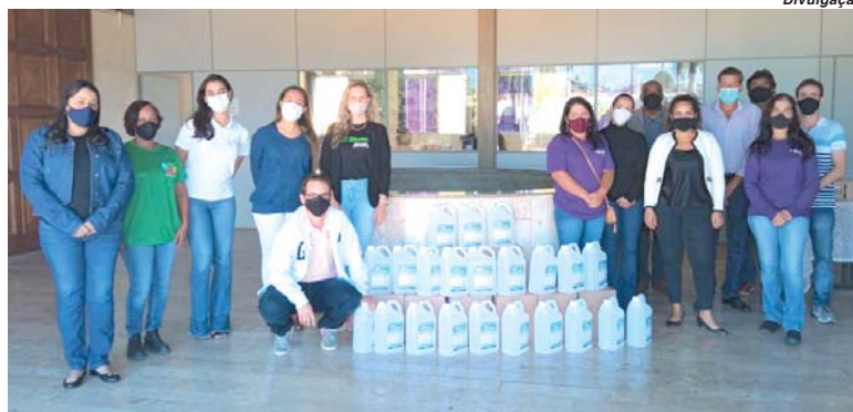
Equipe do Sicredi, da Cidassp e representantes das associações de catadores de materiais recicláveis