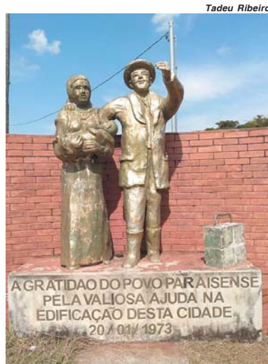
Praça dos Imigrantes, no Bairro Lagoinha, está faltando a estátua que existia e simbolizava a criança filho dos imigrantes