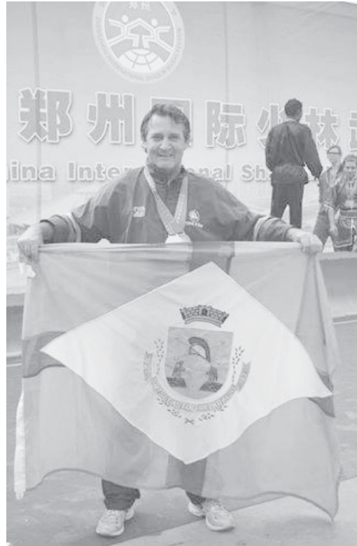
Academia reúne gerações em busca de saúde e qualidade de vida através das artes marciais

A Associação Shaolin do Norte Mestre Chan é totalmente legalizada junto aos órgãos superiores. “Somos registrados na federação, confederação e no Ministério do Esporte e que nos credencia a levarmos nossos alunos para qualquer parte do mundo. Tivemos alunos na