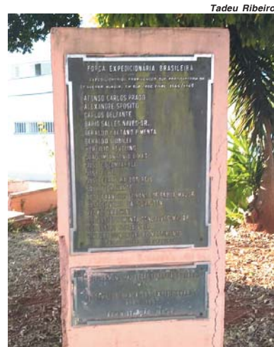
Praça dos Expedicionários na Mocoquinha, está faltando um obelisco em forma de Capacete Militar que existia anteriormente homenageando e simbolizando os pracinhas paraenses que lutaram na 2ª Guerra Mundial