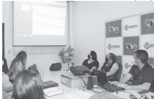
Reunião entre prefeitos da região ocorreu no fim de semana quando foi debatida a situação dos pacientes da região

São Sebastião do Paraíso está conseguindo manter índices positivos em relação a internação de pacientes nos últimos dias com indicadores diferentes aos registrados em outras cidades, que apresentam superlotação e até falta de vagas. Com taxa de ocupação na UTI Covid em torno de 35% no Boletim Epidemiológico desta segunda-feira, 8, o Município vem chamando atenção do Estado que até solicitou a possibilidade de a Santa Casa local pudesse receber pacientes de outras regiões.