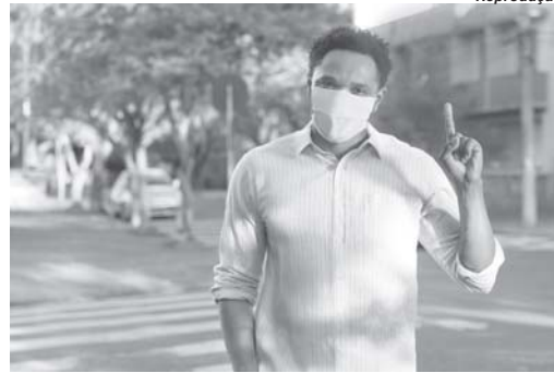
Sicredi das Culturas RSMG irá realizar Assembleia digital de 17 a 24 de março

Durante a Assembleia serão apresentados aos associados os resultados do exercício de