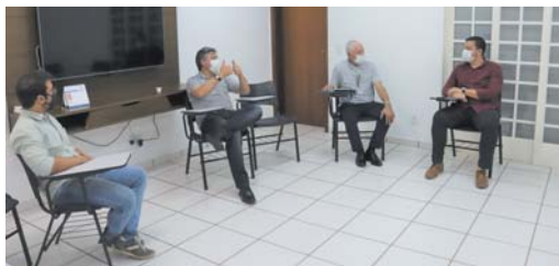
Dirigentes do Sicredi na ACIMS