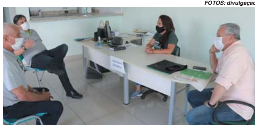
Dirigentes do Sicredi no Sindicato dos Produtores Rurais de Monte Santo de Minas

O Sicredi é a primeira instituição financeira cooperativa do Brasil e atualmente conta com 5 milhões de associados em mais de 100 cooperativas, e a Sicredi das Culturas RS/MG é uma delas. A expansão da cooperativa para Minas Gerais integra um intenso projeto coordenado pela Central Sicredi Sul/Sudeste, com a participação de diversas cooperativas do Rio Grande do Sul e de Santa Catarina. A Sicredi das Culturas RS/MG atua em 13 municípios do Rio Grande do Sul e é responsável pela expansão do Sicredi em mais 28 municípios mineiros, totalizando 41 municípios e cerca de 700 mil habitantes em sua área de ação. Presente na região desde 2019, a cooperativa já possui agências em Guaxupé, Muzambinho, Passos