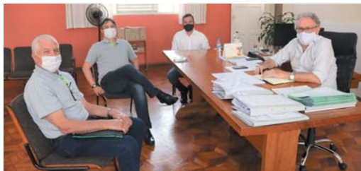
Sicredi em agenda na Prefeitura de Monte Santo de Minas