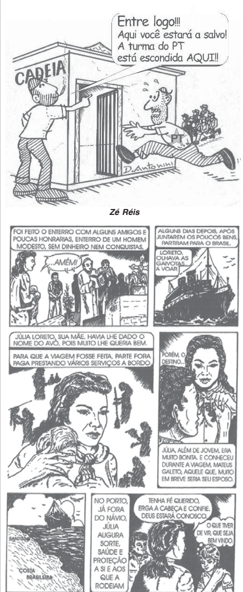
Página do Livro Loreto