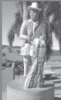
Estatua do Congadeiro em São Tomás de Aquino