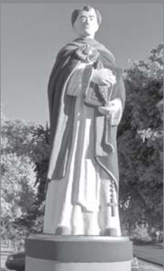
Estatua na entrada de São Tomás de Aquino