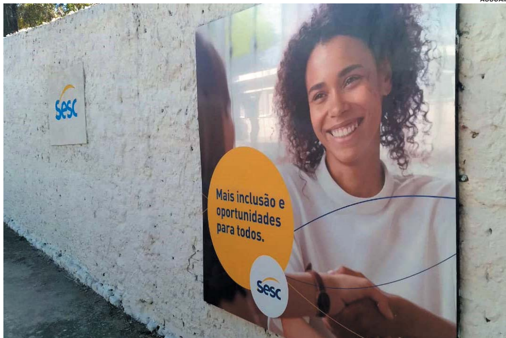
Muros da Praça de Esportes Castelo Branco foram pintadas com a logomarca do Sesc