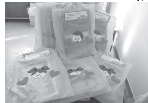
Kites de material escolar foram distribuídos para os alunos nas escolas da Rede Municipal de Ensino

Em São Sebastião do Paraíso o PET está sendo utilizado como material de apoio. "É um material bom e rico. Ele está servindo de apoio e sendo incorporado ao nosso planejamento. Também orientamos