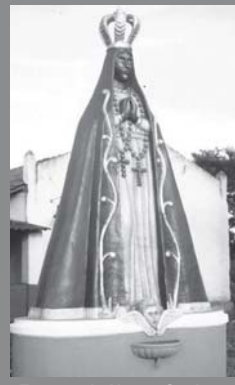
Estatua de Nossa Senhora Aparecida Bairro Rural Queimada Velha