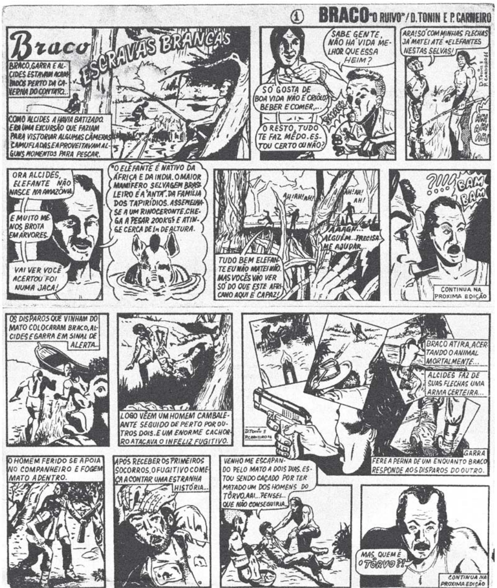
Tiras semanais publicado no Jornal Sudoeste - Braco