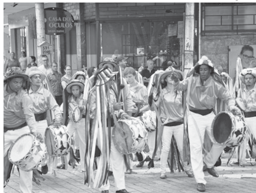
Congada está entre os principais atrativos folclóricos e culturais da cidade

O Instituto Estadual do Patrimônio Histórico e Artístico de Minas Gerais (Iepha-MG) divulgou a tabela com a pontuação provisória do ICMS Patrimônio Cultural - exercício 2021. Gestores municipais de todo o estado que apresentaram a documentação até 10 de dezembro de 2019 para análise já podem consultar as fichas no site FTP, com senha e login individualizados. São Sebastião do Paraíso é terceiro município com maior nota na região conforme pesquisa realizada pelo Jornal do Sudoeste.