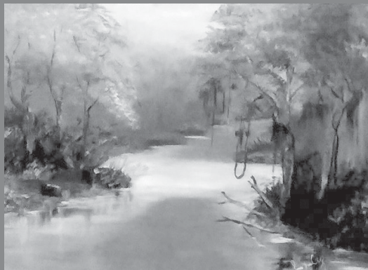
Pintura a óleo