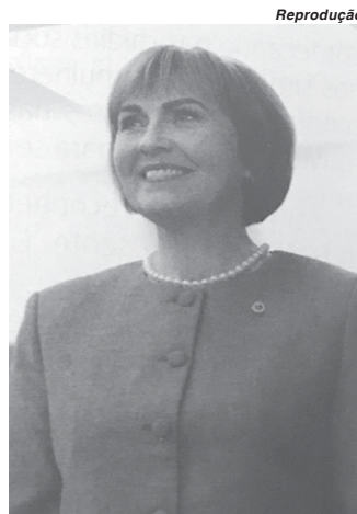
Primeira Presidente Internacional