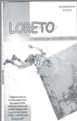
Capa do livro Loreto o menino que aprendeu a voar