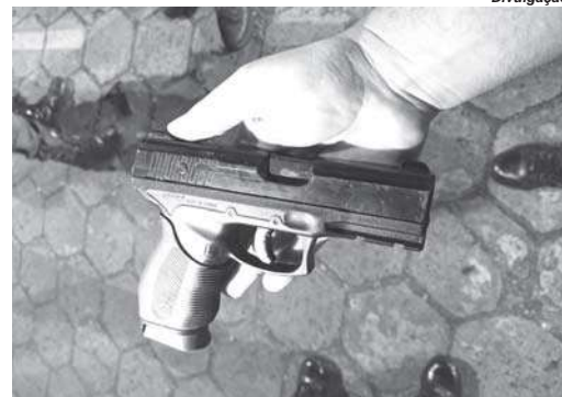
Simulacro de pistola foi encontrada com o suspeito que vive em situação de rua

Segundo informações obtidas pelo Jornal do Sudoeste, um grupo de seis homens fazia consumo de bebidas alcoólicas na praça do Cemitério quando, em determinado momento, dois deles passaram a se desentender. Um deles, então, sacou uma suposta pistola da cintura e colocou a arma na boca de seu desafeto, o ameaçando. O acusado é natural de Franca – SP.