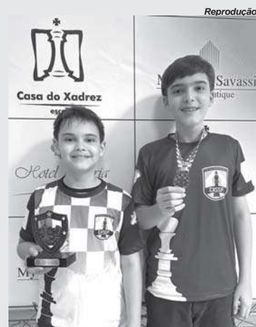
O campeonato aconteceu no famoso Hotel Glória Resort em Caxambu-MG

O CXSSP parabeniza seus atletas pelo excelente desempenho.