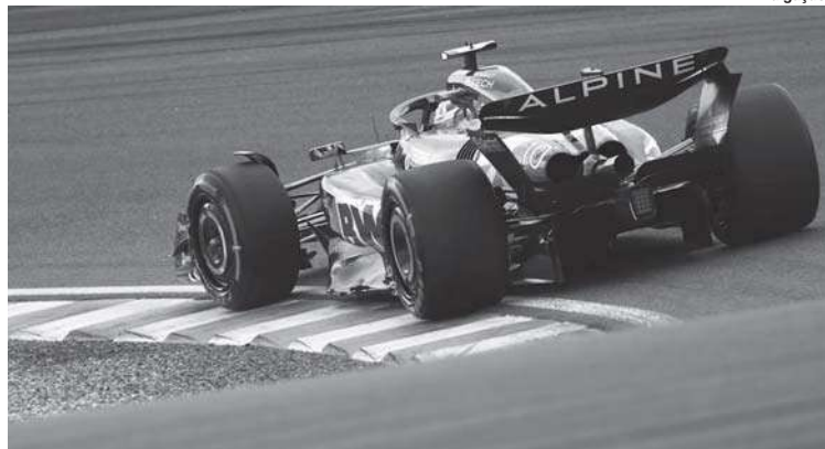
Alpine é a penúltima colocada no campeonato: apenas 13 pontos em 18 corridas

A Renault decidiu que vai encerrar seu programa de motores de F1 após a temporada de 2025. Isso quer dizer que em 2026 quando o novo regulamento entrar em vigor na F1 com maior ênfase na área de motores, a Alpine passará a ser equipe cliente, provavelmente da Mercedes.