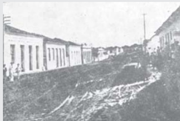
Mocoquinha, av. Angelo Calafiori, a rua não era calçada