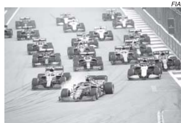
Até o GP da Rússia, famoso pela monotonia, arrancou suspiros

Estamos diante de uma disputa acirrada entre Red Bull e Mercedes; Verstappen X Hamilton, e depois que a 'água baixou' na Rússia, ficou mais fácil entender nas entrevistas que a tática da Mercedes em chamar Hamilton para substituir os pneus de pista seca pelos de chu-