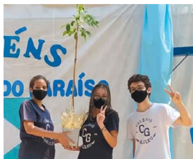
Alunos da equipe Ipê Celeste