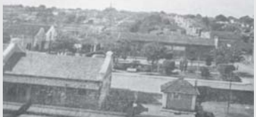
Uma vista da Estação Mogiana