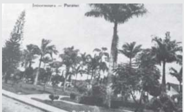
Praça da Fonte - Praça Com. João Alves