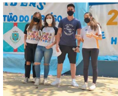
Alunos da equipe Catuaí