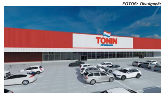
Fachada da Futura loja em Bebedouro

"Em nossa empresa já há bastante tempo definimos nosso propósito, quais são os valores da empresa e temos seguido muito isso. A questão do propósito se tornou muito valorizada nos últimos tempos. E não é fácil definir. Na Tonin, o nosso é criar bem estar para as pessoas, para a sociedade e meio ambiente. Significa viver bem, disponibilizar bem as mercadorias, trabalhar de ma-