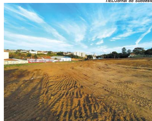
Em Paraíso local da nova loja Tonin, localizado na avenida Delson Scarano, fundos do Tiro de Guerra

neira honesta, realmente com foco no consumidor, nas pessoas", define.