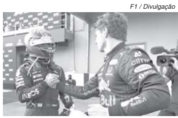
Hamilton (E) cumprimenta Verstappen (D). Até aqui, empate técnico

A F1 está em Portugal para a terceira etapa do Mundial, marcado até aqui por ótimas disputas. Os estatísticos dirão que é empate técnico a disputa entre Lewis Hamilton e Max Verstappen. Cada um tem uma pole, uma vitória, um 2º lugar, e o que separa os dois na