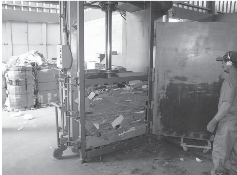
Segundo secretário, mais de 10 toneladas de papelão foram coletadas na cidade no primeiro mês de trabalho da associação parceira da prefeitura

Atualmente, o serviço opera com dois caminhões que cobrem toda a zona urbana da cidade, dividida em cinco se-