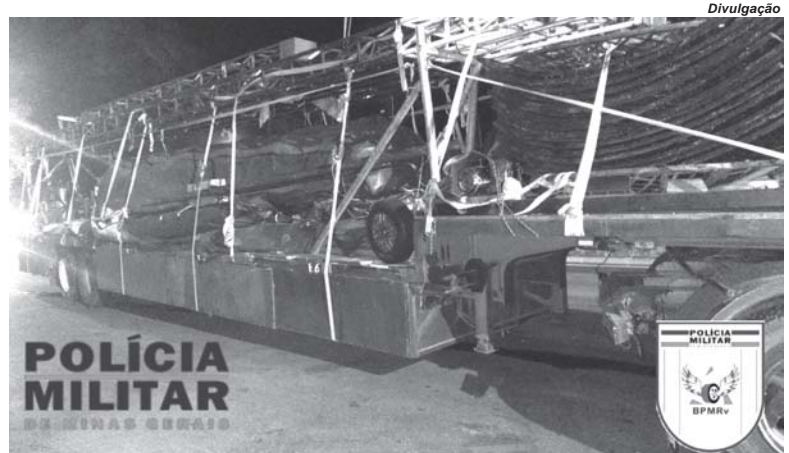
Semirreboque foi apreendido durante operação realizada na noite de segunda-feira na MG-050

Depois de solicitar os documentos ao condutor, os policiais constataram no sistema digital da polícia que o número da placa e do chassi do veículo era, originalmente, de um reboque de carga de apenas duas toneladas - um veículo conhecido popularmente como "carretinha de carga",