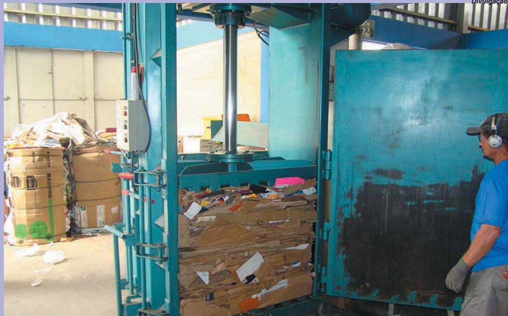
Segundo secretário, mais de 10 toneladas de papelão foram coletadas na cidade no primeiro mês de trabalho da associação parceira da prefeitura