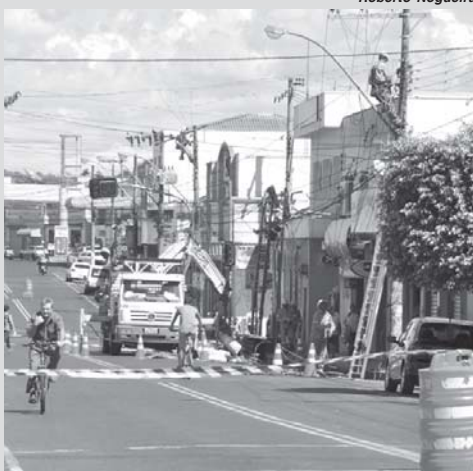
Ruas da região central da cidade passarão por obras de manutenção da rede elétrica

A Companhia Energética de Minas Gerais - CEMIG - informa que neste sábado, dia 25, vai realizar serviços de manutenção na rede elétrica em São Sebastião do Paraíso. O atendimento acontecerá em várias ruas do centro da cidade e algumas ruas de bairros próximos ao centro. Desta forma, será necessário a interrupção do fornecimento de energia no período entre 10h às 16h.