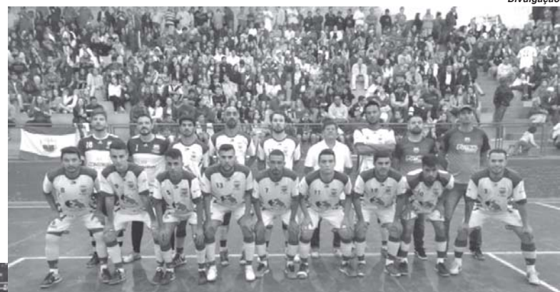
Equipe de Monte Santo faz neste sábado decisão da Taça EPTV em Poços de Caldas

Monte Santo foi para semifinal contra Andradas e perdeu por 10 a 1. No entanto como Andradas teria utilizado um jo-