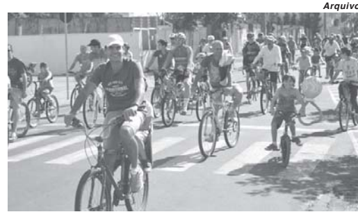
Cerca de 190 paraenses participaram da primeira edição do evento

Em 2017, foram pelo menos 190 inscrições. A pedalada partiu da Arena João Mambrini e, além do hasteamento da bandeira e canto do Hino Nacional com a participação de atiradores do Tiro de Guerra 04-025 e Guarda Municipal, reuniu também crianças, adolescentes e adultos, num percurso de