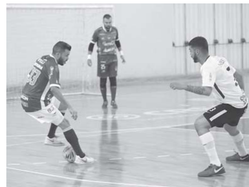
Time de Paraíso já classificado voltará a jogar na Arena na próxima terça-feira

Em partida realizada na noite de terça-feira, 21, pela primeira fase da LPF (Liga Paulista de Futsal) as equipes da AABB e a Intelli Paraíso empataram por 2 a 2. O jogo foi realizado no Ginásio Alaor Ferrari, em São Paulo. A Intelli volta a quadra pela competição na próxima terça-feira, 28, na Arena João Mambri, às 20 horas contra o time de Barueri.