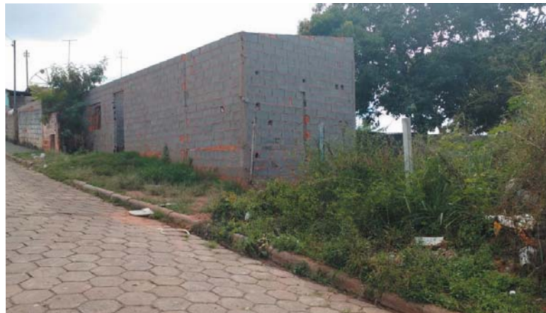
Na Rua Cláudio Herculano Duarte no Bairro João XXIII está sendo construído irregularmente uma Casa em Área de Risco

Ele sugere que a prefeitura faça uma abertura de caminho até o ponto mais próximo de outras residências que também estão construídas à beira do grande buraco, autorizando condutores de veículos que fazem transporte de entulhos, caminhões ou charretes, jogarem naquele local somente en-