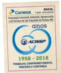
Selo de 60 anos da Acissp