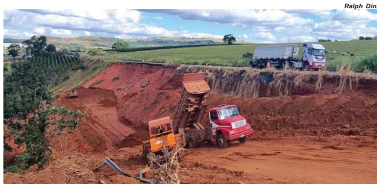
Equipe do DER-MG trabalha na recuperação do aterro danificado pelo deslizamento de terra

O incidente ocorreu nas primeiras horas da manhã de 1º de fevereiro, depois que a