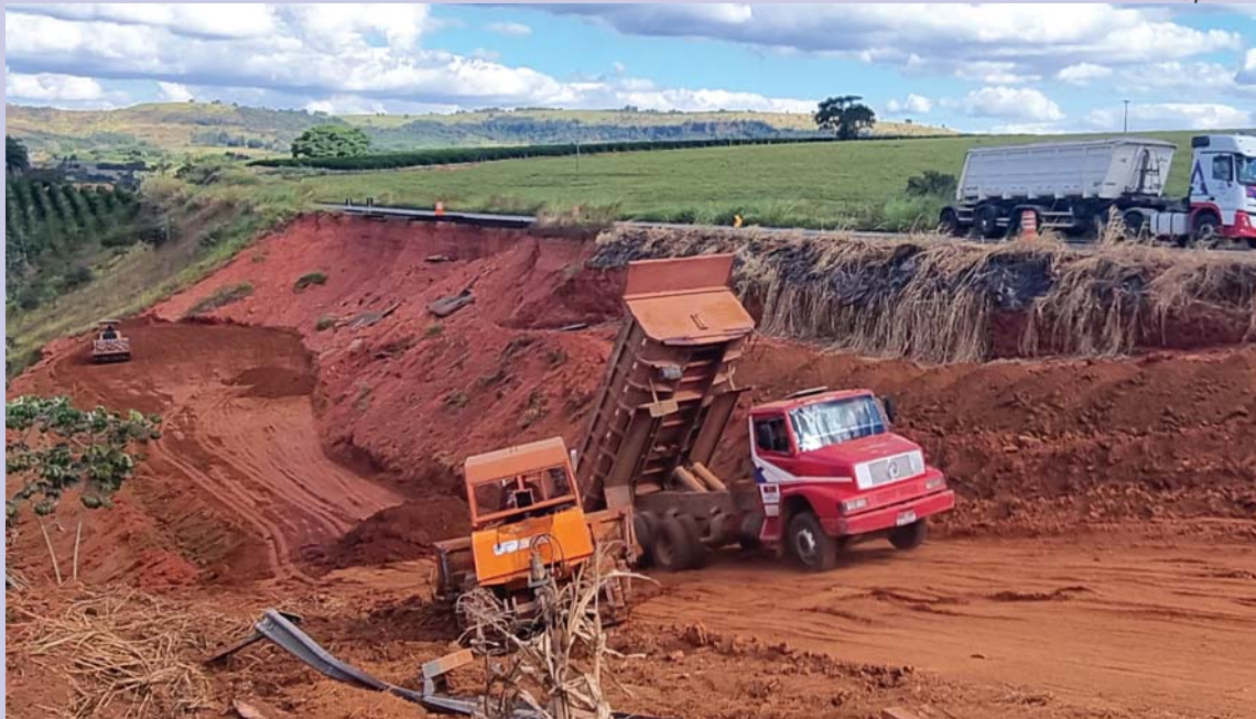
Equipe do DER-MG trabalha na recuperação do aterro danificado pelo deslizamento de terra

ACISSP promove workshop gratuito sobre delivery