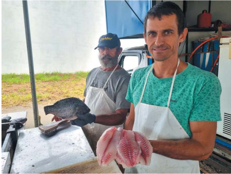
Empresário já conta com um ajudante e deve contratar mais pessoas para atender a demanda da Semana Santa

Para dar conta da demanda, o vendedor prepara e congela filés de tilápia (o carro-chefe da empresa) para vender em sua barraca, situada à avenida Oliveira