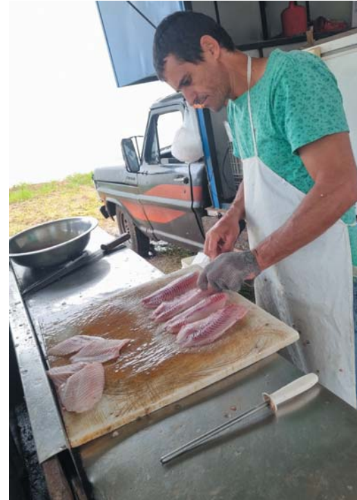
Filé de tilápia é o produto mais procurado pelos clientes para as celebrações da Sexta-Feira da Paixão e a Páscoa

Sobre o preço dos produtos, Rubens explica que os peixes sofreram uma alta de cerca de 15% em relação ao ano passado. Em 2023, o quilo do filé de tilápia custava R$48. Hoje,