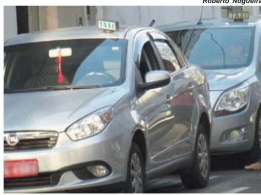
Cadastros de mais de 40 profissionais de Paraíso foram enviados pela Prefeitura ao Governo Federal

Os números parciais foram apresentados nesta segunda-feira 15, pelo Ministério do Trabalho e Previdência. Também durante a manhã o ministro José Carlos Oliveira concedeu uma entrevista coletiva quando fez esclarecimentos sobre