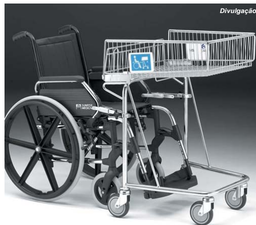
Projeto aprovado na Câmara dos Vereadores possibilitará que cadeirantes façam compras com carrinhos adaptados