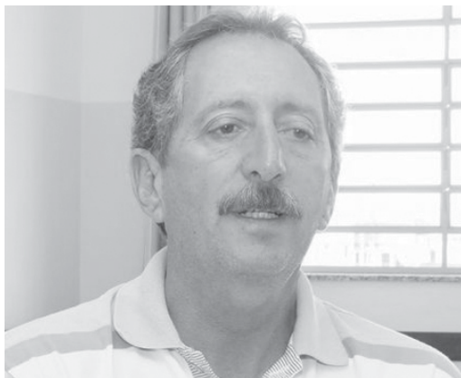
Prefeito de Jacuí Geraldo Magela