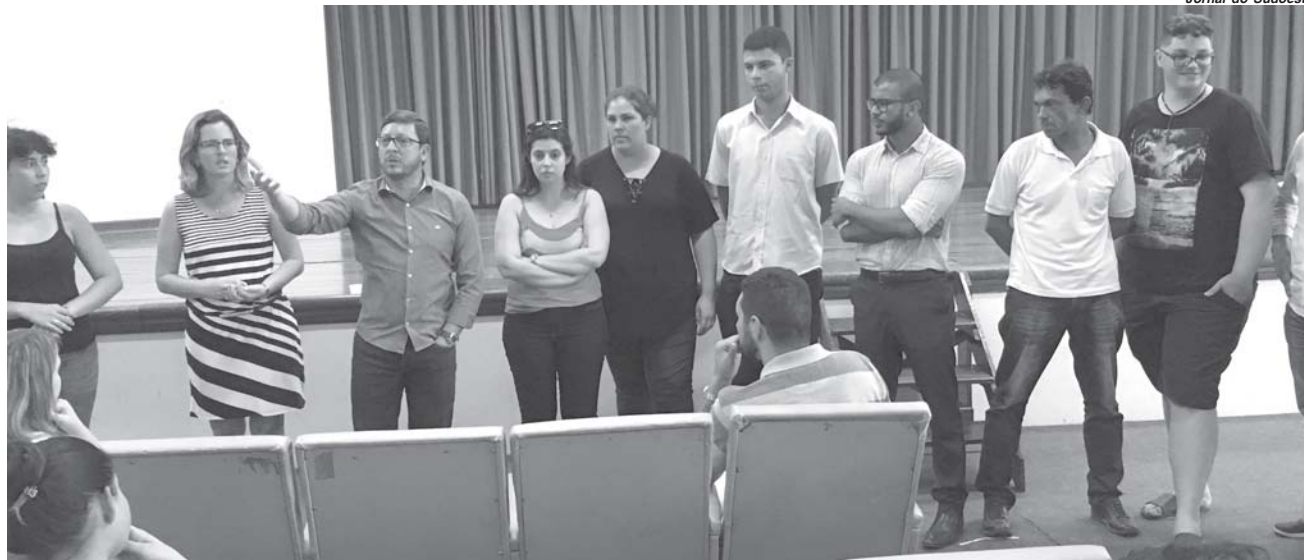
Diretoria temporária é escolhida para tentar manter convênio entre ACEP e Prefeitura