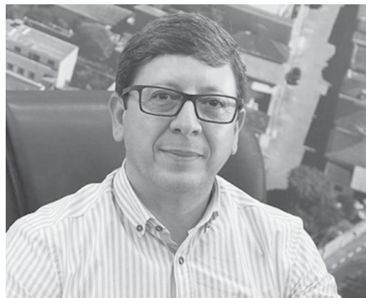
Prefeito de São Sebastião do Paraíso Walker Américo Oliveira