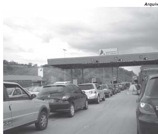
Arrecadação de ISSQN no pedágio de Paraíso gera R$ 700 mil no ano de 2018

Além do município paraense também são contempladas com o repasse as cidades