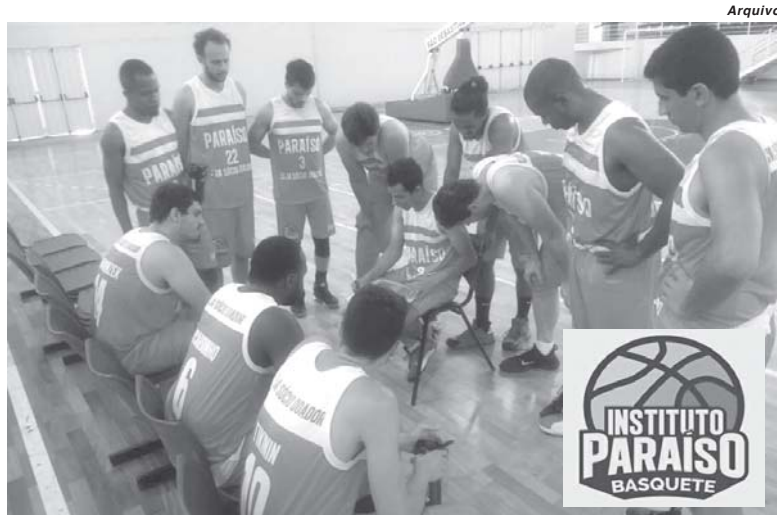
Instituto Paraíso Basquete faz parceria com Prefeitura para utilizar Arena Olímpica para jogos nesta temporada

"Estamos buscando uma Parceria Pública Privada (PPP) para nos ajudar a manter e também realizarmos alguns investimentos, já que no ano passado tivemos um gasto elevado e pagamos tudo do bolso", explica. Agora acaba de ser acertado um acordo com a Secre-