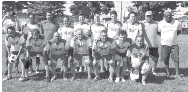
Equipe do Ouro Verde jogou na reabertura do Estádio Municipal Irmãos Capatti, o Campão

três pontos ganhos cada. União e Inter de Franca jogaram uma vez e perderam enquanto que o Altinópolis não jogou. Para este sábado os líderes se enfrentam às 16h30, no campo do Senior's Paraisense. Também no mesmo horário no Estádio Comendador João Alves o União receberá o Internacional, ambos buscando a reabili-