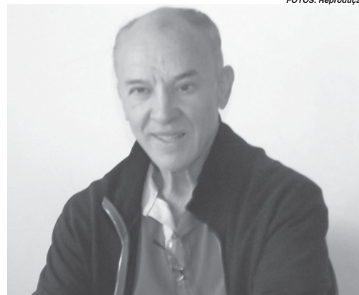
Prefeito de São Tomás de Aquino José Carlos Pimenta