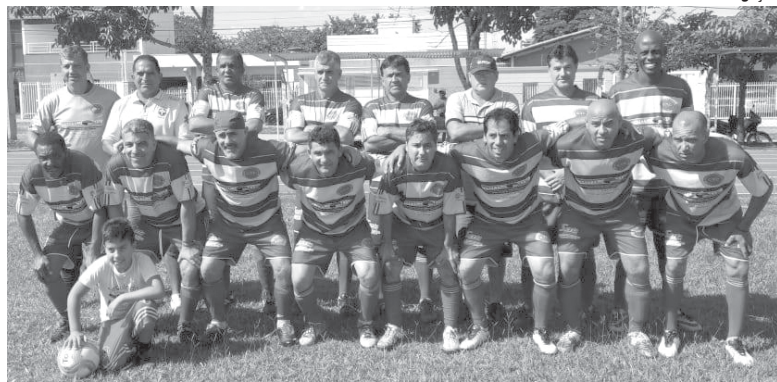
Caram veio a Paraíso e venceu o Ouro Verde isolando-se na ponta da tabela de classificação

No grupo B, os times estão embotados e equilibrados na tabela de classificação. As equipes do Senior's e do Termópolis dividem a liderança com