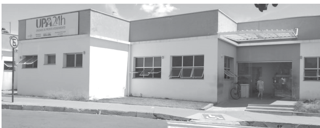
Os Vítros das janelas das salas de espera da UPA são inadequados pra proporcionar ventilação aos pacientes

Realmente essas pessoas estão com toda a razão, pois constatamos o fato do calor insuportável nas duas salas e corredores da UPA. Um dos pacientes levou duas horas e dez minutos para ser atendido. Anteriormente estivemos no local acompanhando uma paciente cuja espera foi mais de quatro horas, e constatamos que outros aguardavam há cerca de seis horas, isto