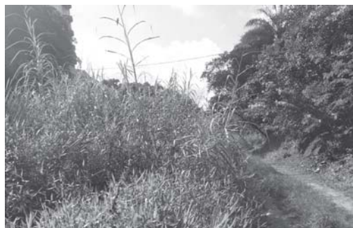
Neste trecho da Rua Estrada de Ferro, matacão já está quase deixando está via pública intransitável

são os moradores, que nesta semana mataram uma cobra que saiu de dentro do referido lote, que dizem ser da Prefeitura.