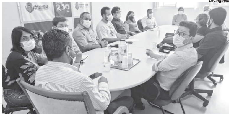
Durante reunião nesta semana foram tratados mais detalhes para ampliação da parceria no município que envolve a UFLA e a Santa Casa

A reunião nesta semana visa estreitar os laços envolvendo a Universidade Federal de Lavras (UFLA), a Prefeitura e a Santa Casa de Misericórdia, disse o