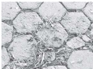
Esta cobra morta saiu de dentro de um terreno sujo de matos, na rua Rita Borges Libório, no Jardim Vitória II