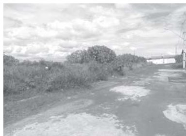
Nesta gleba suja de matos na rua José Luiz Filho, no Jardim Diamantina, foram vistas duas cobras cascaveis