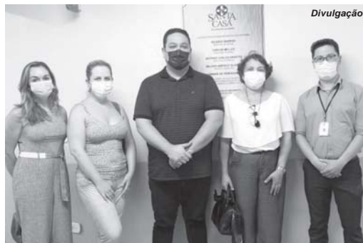
Diretora da DRS Passos com suas assessoras foram recebidas por dirigentes da Santa Casa de Misericórdia

rência Regional de Saúde têm por finalidade garantir a gestão do Sistema Estadual de Saúde nas regiões do Estado. Também é responsável pela coordenação, monitoramento e avaliação das atividades e ações de saúde que abrangem cerca de 30 municípios.