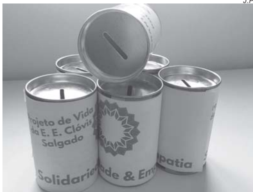
Cofres estarão espalhados pelo comércio até 10 de outubro. Recursos serão destinados ao Lar Pedacinho do Céu

O projeto teve início no ano passado, quando se arrecadou R$ 400 em um mês que os cofrinhos ficaram espalhados por mais de 10 pontos comerciais do município. "Com esse valor, foi possível comprar diversos produtos que foram destinados ao Lar Pedacinho