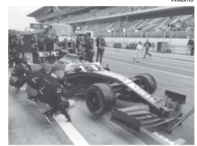
Sem diretor-técnico e carro parcialmente irregular, Williams está virando time de várzea

aqui duas semanas atrás, tem origem na fraca administração da chefe-adjunta, Claire Williams, filha de Frank Williams, e no instável departamento técnico, agora à deriva com a licença(?) de Paddy Lowe alegando razões pessoais.