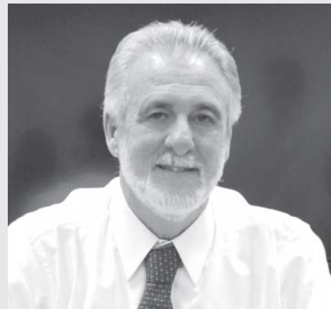
A coluna cumprimenta o diretor do SEBRAE, ex-ministro, Carlos Melles, aniversaria nesta segunda, dia 11.