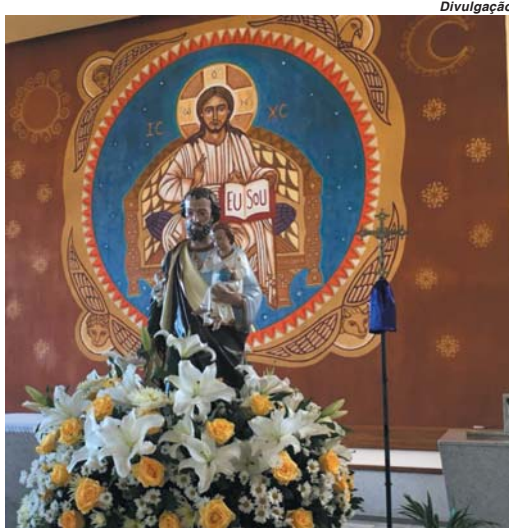
Comunidade festeja São José operário, patrono do trabalhador

(17), após a missa, às 11 horas terá o leilão de gado no estacionamento da igreja. Em seguida na parte festiva acontecerá o almoço no salão paroquial a partir do meio dia quando também será servido o tradicional "porco à paraguaia". Mais da metade dos ingressos que são limitados já havia sido vendidos. No local acontecerá show de prêmios com sorteio de duas bicicletas, um smartphone, um forno microondas e uma churrasqueira pré-moldada.