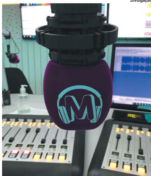
Massa FM é uma das redes de rádio que mais cresce no Brasil estará no dial em Paraíso

Conforme informações da assessoria de imprensa do Grupo Massa, divulgadas pelo site Tudoradio.com, a Rede Massa FM, liderada pela Massa FM 97.7 de Curitiba, começa 2019 com um projeto ambicioso. A proposta é de fechar o ano com 38 afiliadas pelo Brasil, incluindo algumas em capitais nesse pacote. A rede que iniciou o ano com dezenove afiliadas deverá chegar em breve a 25 associadas com o ingresso das novas rádios na rede.