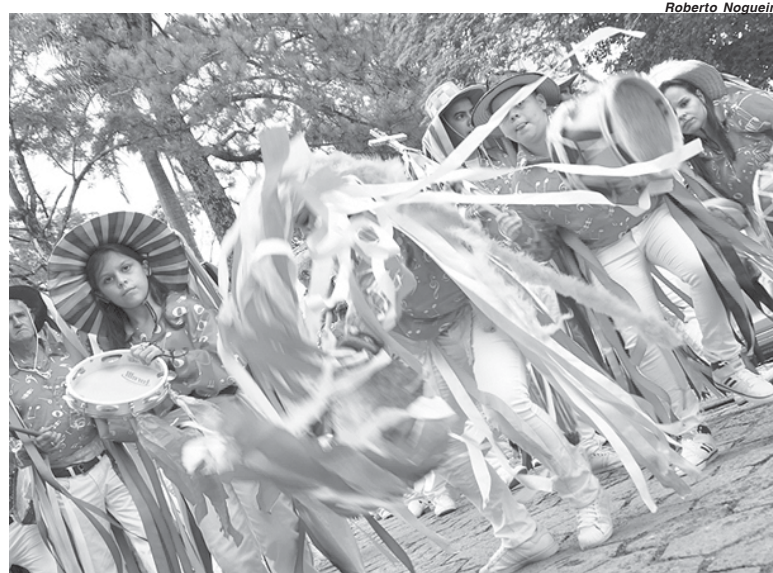
Pesquisa possibilitará preservar histórias e memórias ligadas a cultura dos Congados inclusive dos grupos paraenses

A produção do formulário, elaborado pela equipe técnica do Instituto, contou