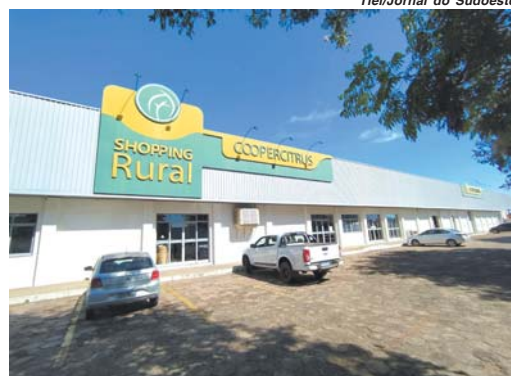
Tiel/Jornal do Sudoeste

A campanha estará disponível em todas as unidades da Coopercitrus. Para preservar a saúde e segurança de todos, os atendimentos e negociações serão feitas através de horários agendados com os consultores nas lojas e também por meios digitais, whatsapp, telefone e e-mail. Na primeira edição da