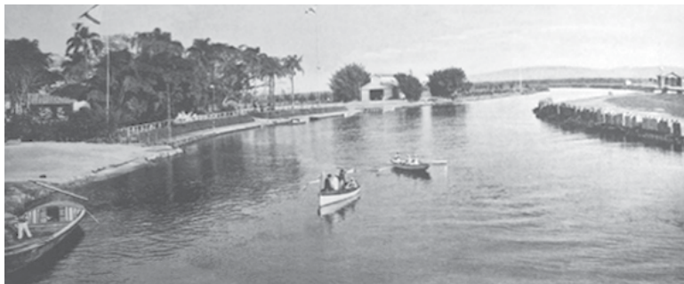
Neste local situam-se os clubes Espéria e Regatas Tietê, os moradores praticavam esportes náuticos, como natação e remo

Quando a capital paulista entrou em seu importante ciclo de desenvolvimento, a paisagem urbana passou a ser explorada como paisagem moderna, de uma cidade que prospera economicamente, vê nascer sua indústria e ampliar seu comércio, com um crescimento populacional decorrentes dos necessários surtos migratórios.