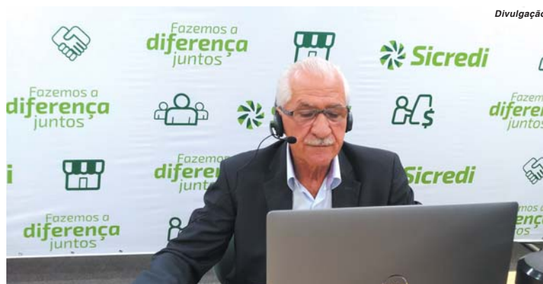
Sicredi das Culturas realizou Assembleia Geral Ordinária 2021 de forma digital

Em 2020, quando completou 95 anos de história, a Sicredi das Culturas RS/MG fechou o ano com 56.752 associados, o resultado da coo-