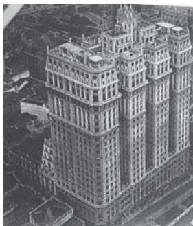
Vista aérea do recém-inaugurado edifício Martinelli-1928.