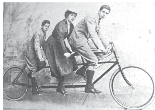
Família Almeida Prado.