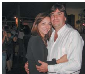
Leco, Cartório de Registro Civil e Renata