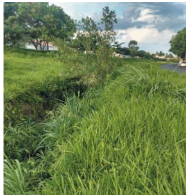
Dentro da canalização do Córrego Coolapa está sujo de mato e nasceram diversas árvores também