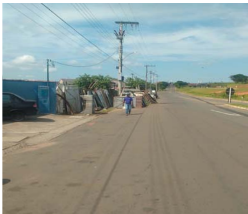
Na Rua Florentino Cândido de Rezende no Alto Bela Vista, pedestres são obrigados a caminhar dentro da Rua devido a calçada estar ocupada com material usado de construção

Existem dois fatores bastante preocupantes: nas proximidades da referida via pública há uma escola e um ginásio poliesportivo, onde o fluxo de pedestres é grande,