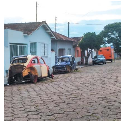
Carcaças de carros velhos continuam estacionados no leito da Rua Washington Luiz, no Bairro Vila Mariana