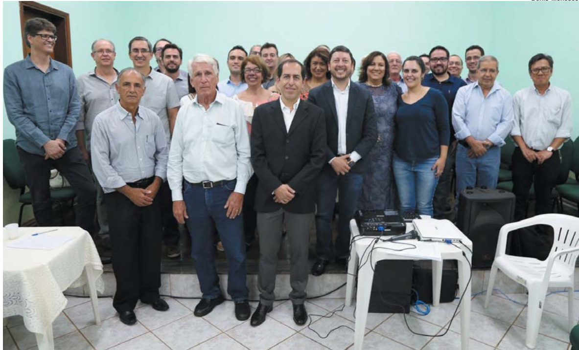
Integrantes da nova provedoria já possuem projetos e ações em andamento para que o hospital continue crescendo