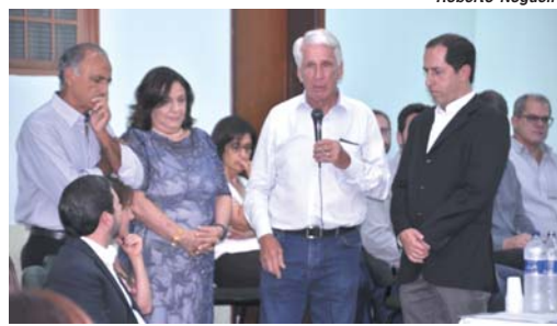
Comissão de Intervenção do hospital apresentou relatório com as contas da instituição saneadas após três anos de trabalho

Ele lembrou que a princípio foi pedido muita paciência até que o grupo de trabalho entendesse o que estava acontecendo na administração da Santa Casa. "Agradeço a compreensão