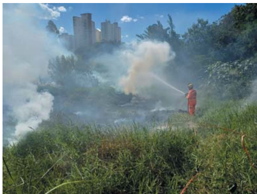
Incêndio em mata no Jardim das Paineiras deu trabalho aos bombeiros e deixou o céu da cidade tomado pela fumaça

Os trabalhos tiveram início na sexta-feira com três focos de incêndio significativos. Dois deles ocorreram no bairro Jardim das Paineiras, um em um lote vago e outro em uma área verde na entrada do bairro. Este último, localizado em um terreno de acesso difícil, de declive acentuado e vegetação densa, rapidamente escalou para um incêndio de grande proporção, enchendo o bairro de fumaça e gerando um