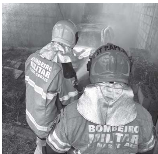
Bombeiros tiveram trabalho para apagar as chamas que destruíram veículo no último final de semana

Residência teve curto-circuito, enquanto carro abandonado foi consumido pelas chamas; ações rápidas evitaram maiores danos