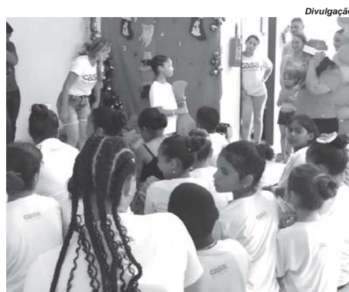
kits serão distribuídos durante a tradicional festa de Natal da Casa São Francisco

A Campanha de Natal da Casa São Francisco já é uma tradição e um dos momentos mais aguardados pelas crianças. Cada uma delas escreve uma cartinha com seus desejos natalinos, pedindo um presente especial. A iniciativa permite que voluntários adotem essas car-