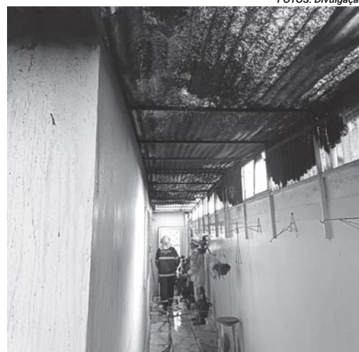
Telhado de residência foi parcialmente destruído pelo fogo

Mais tarde, por volta das 11h50, os bombeiros foram acionados novamente, desta vez para atender a um incêndio em um veículo Fiat Palio, completamente tomado pelas