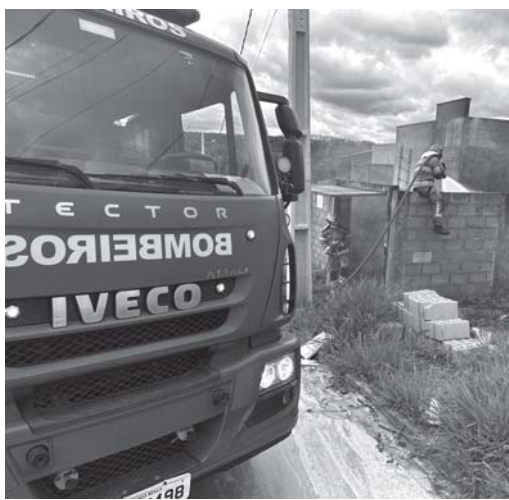
Militar precisou subir no muro do imóvel para conseguir acessar o local tomado pelas chamas

Na madrugada de sexta-feira, 15 de novembro, um curto-circuito na fiação elétrica provocou um incêndio em uma residência na Rua Estados Unidos. As chamas atin-