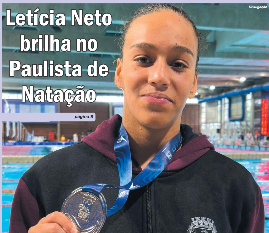
Nadadora é uma das grandes promessas da natação nas provas de 50 metros